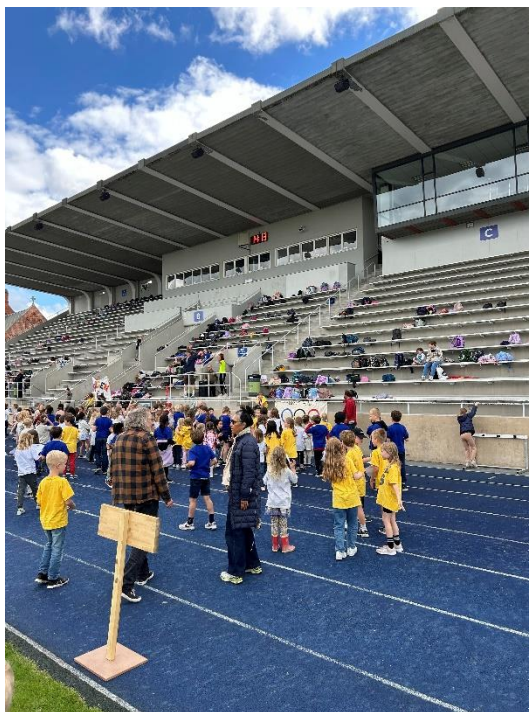
OL på Østerbro Stadium med KKFO'en